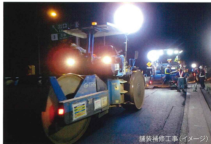
舗装補修工事(イメージ)

工事実施期間中はご不便とご迷惑をおかけいたしますが、何卒、ご理解とご協力をお願いいたします。