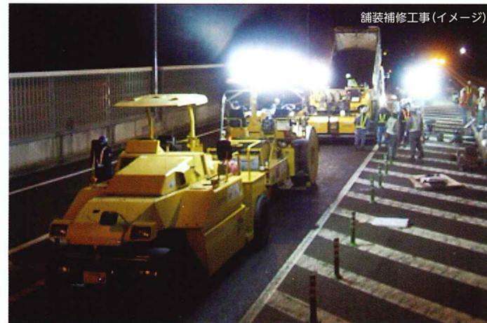
舗装補修工事(イメージ)

工事実施期間中はご不便とご迷惑をおかけいたしますが、何卒ご理解とご協力をお願いいたします。